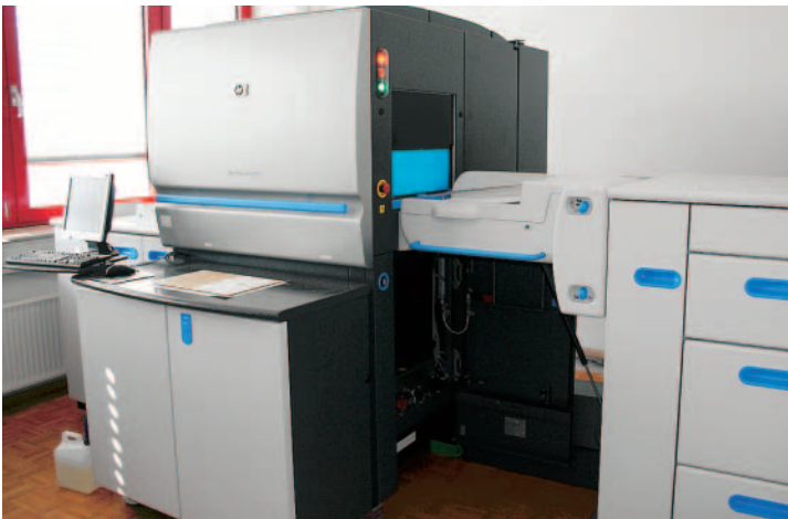
Die HP Indigo press 5000 bei Walter Druck ist in ihren Druckergebnissen mit der Heidelberg SM 74-5 Offsetdruckmaschine aufeinander abgestimmt.

des Familienbetriebs war Stuttgart-Feuerbach. Geschäftszweck laut Gründungsprotokoll war die »Herstellung von Akzidenz-Drucksachen im weitesten Sinn für Kunden im