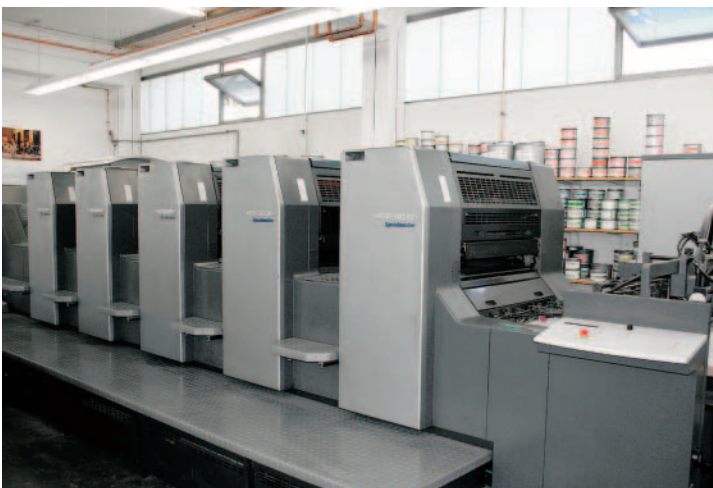
Die höheren Auflagen – auch die A3-Aufträge – werden bei Walter Druck nach wie vor auf der Heidelberg Speedmaster SM 74-5 produziert.

keinen einzigen Kunden nach der Umstellung verloren – aber welche dazugewonnen. Das liegt daran, dass man sich bei Walter Druck besonders Mühe gab, den Geschäftspartnern die neue Technik zu erklären und praxisgerecht nahe zu bringen. Man produzierte zum Beispiel einen eigenen Farbfächer und egali-